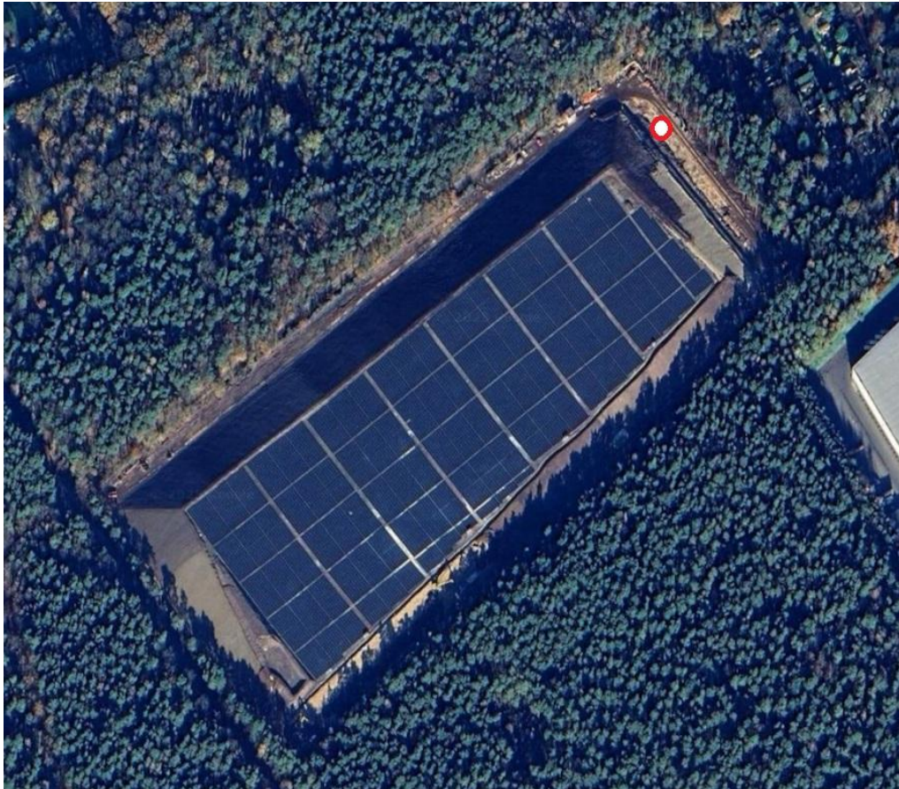
Figuur 2.1. Meetlocatie TSP onderzoek SDE. De rode cirkel is de positie van de TSP monsternemer.

Tijdens de meetperiode is op het terrein van de SDE gewerkt aan de definitieve eindafdichting van het talud van de stort. De weg rond het talud is verlegd. Er is op het talud een definitieve bovenafdichting aangebracht. Deze bestaan uit een gas- en waterdichte bovenafdichting met Trisoplast en HDPE-folie. De drainage is aangepast en de buffervijver en natuurmaatregelen voor soorten als das, steenmarter en hazelworm zijn opnieuw aangebracht.